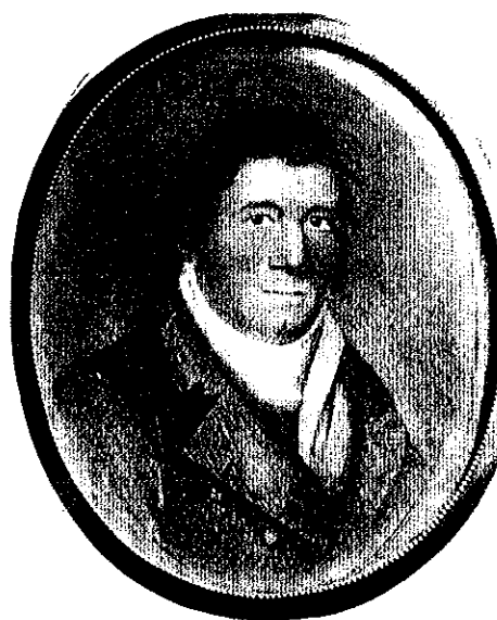
O BOM GIGANTE IMAGEM DE PETER FRANCISCO AOS 38 ANOS